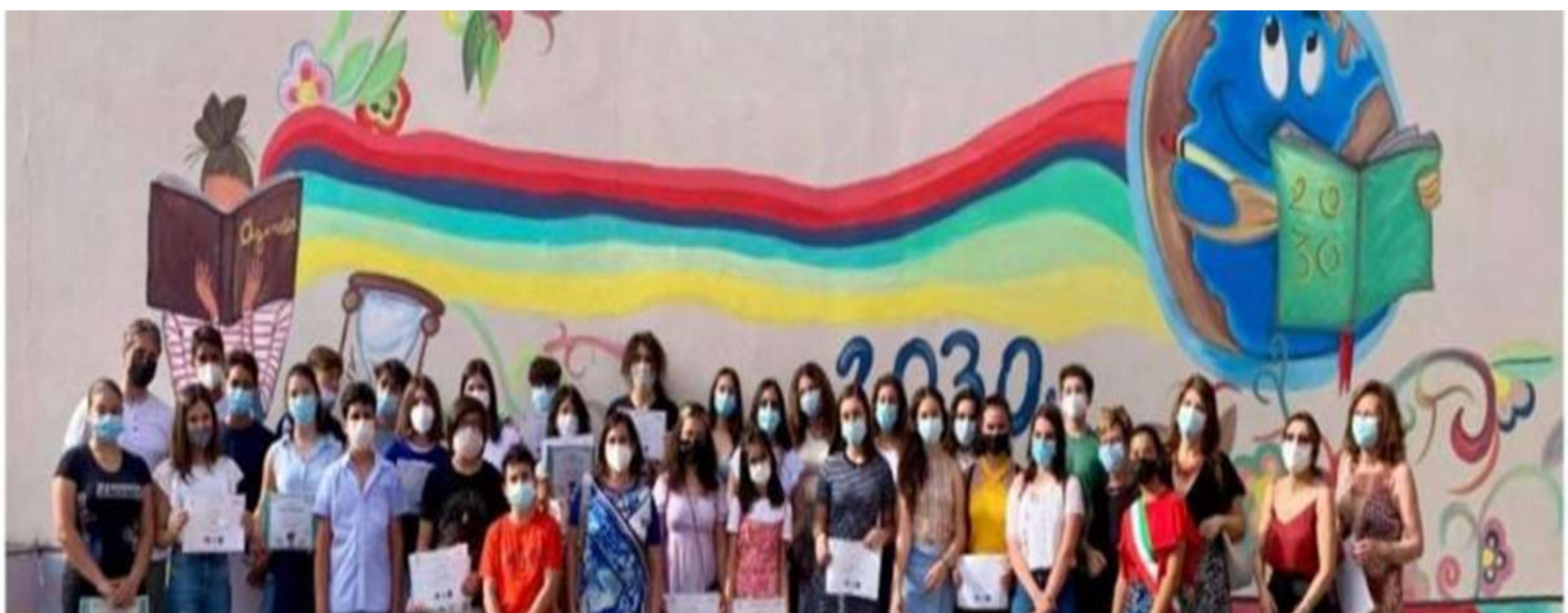
Murales ecologico realizzato da alcuni studenti del nostro Istituto sull' AGENDA 2030...